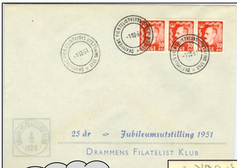
Objekt nr. 222 NK 396 FDC Drammen Utrop kr. 500 Tilslag kr. 840