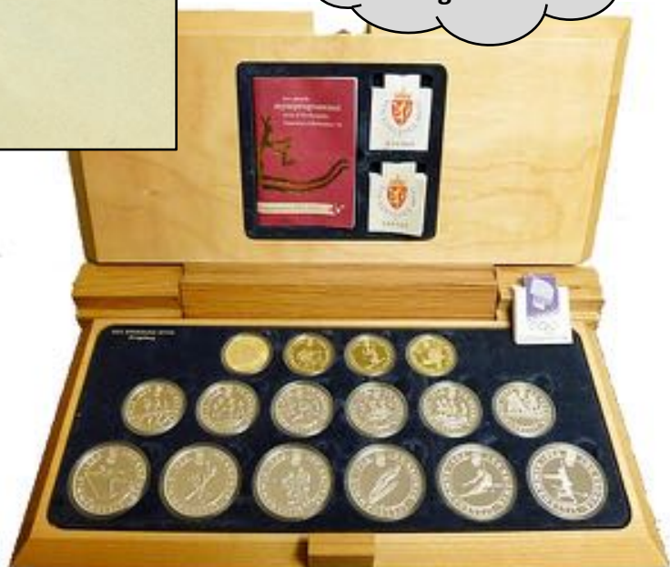
Objekt nr. 752 OL 1994 komplett myntsett Utrop kr. 14000 Tilslag kr. 19000