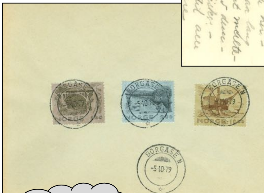
Objekt nr. 292 Borgåsen HJ Utrop kr. 75 Tilslag kr. 925